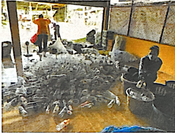
ภาพกิจกรรมการคัดแยกขยะรีไซเคิลประจำเดือน ของกลุ่ม อตล. แต่ละหมู่บ้าน